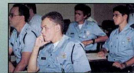
Instrutores do DETRAN