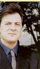
Paracó de Freitas

"O aumento deve-se, em grande parte, à explosão populacional causada pelos condomínios irregulares e assentamentos.