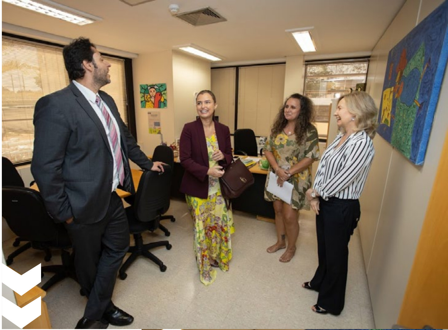
A Administração Superior visitou as instalações da Coordenadoria.